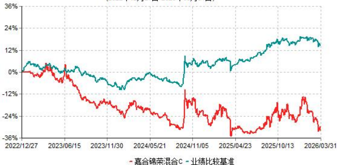
嘉合锦荣混合C累计净值增长率与业绩比较基准收益率历史走势对比图 (2022年12月27日-2026年03月31日)